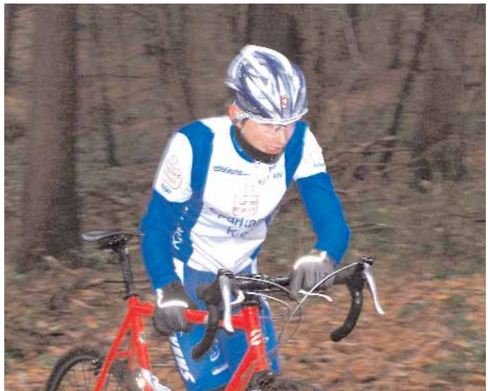
Cross - Harte Arbeit für den Erfolg

Nach der für mich überraschenden Nominierung empfand ich große Freude mit in die Auswahl gekommen zu sein. Die Ehrung war für mich eine Anerkennung meiner Saisonleistung. Beeindruckt haben mich die Glückwünsche von nicht unmittelbaren Wettkampfgegnern und anderen Radsportlern. Es war schon eine etwas andere Siegerehrung als nach einem Radrennen. Es gab mir einen Ansporn für die kommende Saison.