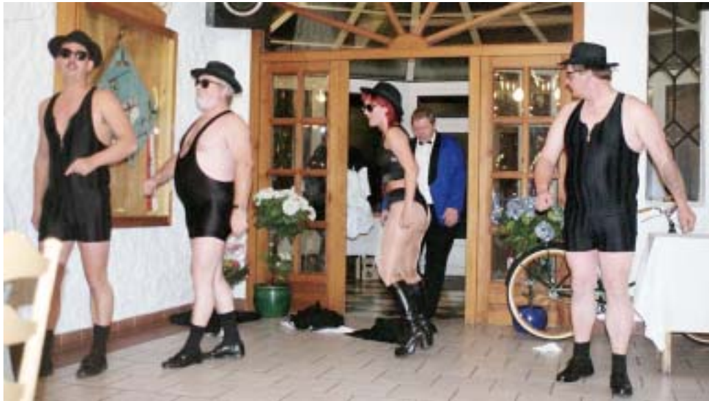
Kultur im Heim ... und die Sieger der Rangliste 2001