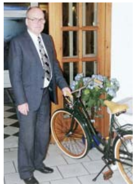
Der 1. Vorsitzende bei seiner Ansprache und der glückliche Tombolagewinner