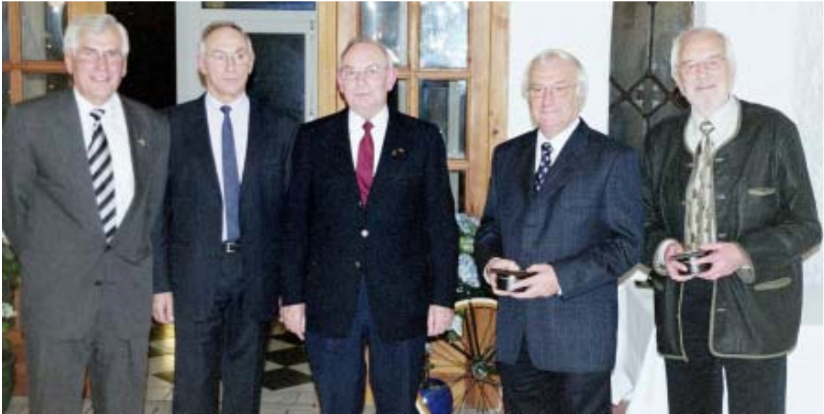
Die 1. Vorsitzenden des KRV