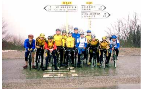
Grand Ballon d'Alsace

Die Umgebung von Mulhouse ist sehr gut geeignet für ein Radsporttrainingslager, da es dort viele flache Ebenen und auch steile und lange Berge gibt, kann man optimal trainieren. Die Straßen sind dort alle sehr gut und auch breit genug, so dass man dort mit einer etwas größeren Gruppe gut fahren kann. Es wird einem dort auch nicht langweilig zu fahren, denn man sieht eigentlich immer die Berge im Hintergrund und auch wenn man nicht in die Berge fährt hat man doch das Gefühl ein Ziel zu haben und das verkürzt die gefühlte Zeit doch erheblich. Ein weiterer Pluspunkt ist, dass es dort kaum regnet, denn die schweren Regenwolken bleiben alle hinter oder über den Bergen hängen. Wir hatten nur ein einziges mal Regen und sonst eigentlich viel Sonne und warm war es auch. Am Abend jeden Tages gab es eine kleine Besprechung mit den Betreuern und mit der versammelten Mannschaft, wo die Ausfahrt besprochen wurde und es die Möglichkeit gab sich über Dinge zu äußern, die jemanden bedrückten.