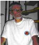
T-Shirt Farbe: weiß Preis: 9,00 € Größe: XS, S, M, L, XL

Die Bestellung wurde von unserem Seniorenwart Ekehard Diezemann am 08.03.2005 entgegengenommen, und nun sind die Sachen alle bei mir und warten darauf, von euch abgeholt zu werden.