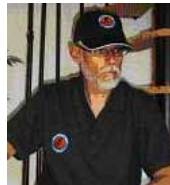
Polo-Shirt Farbe: dunkelblau Preis: 12,00 € Größe: XS, S, M, L, XL