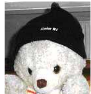
Mütze Farbe: schwarz Preis: 11,00 €